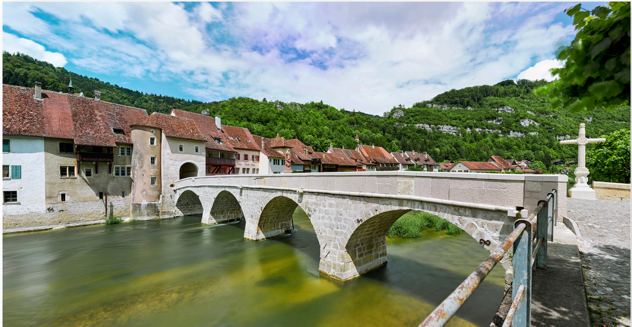
St. Ursanne bei Pruntrut (Porrentruy) (JU) (2018), was die Wolkenfärbung wohl bedeutet?