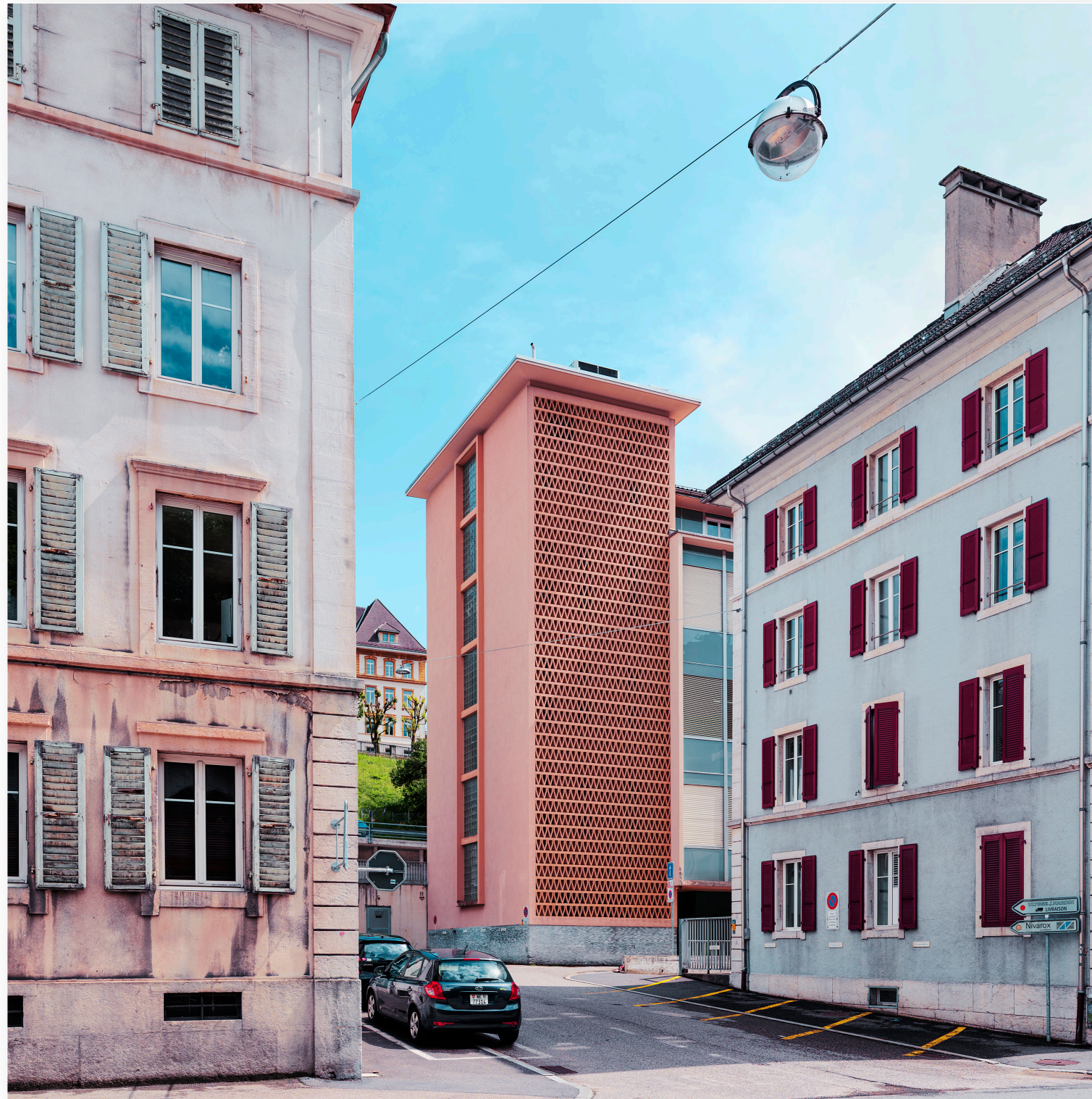
Le Locle (NE), Wohnhäuser im Stadtzentrum (2018)