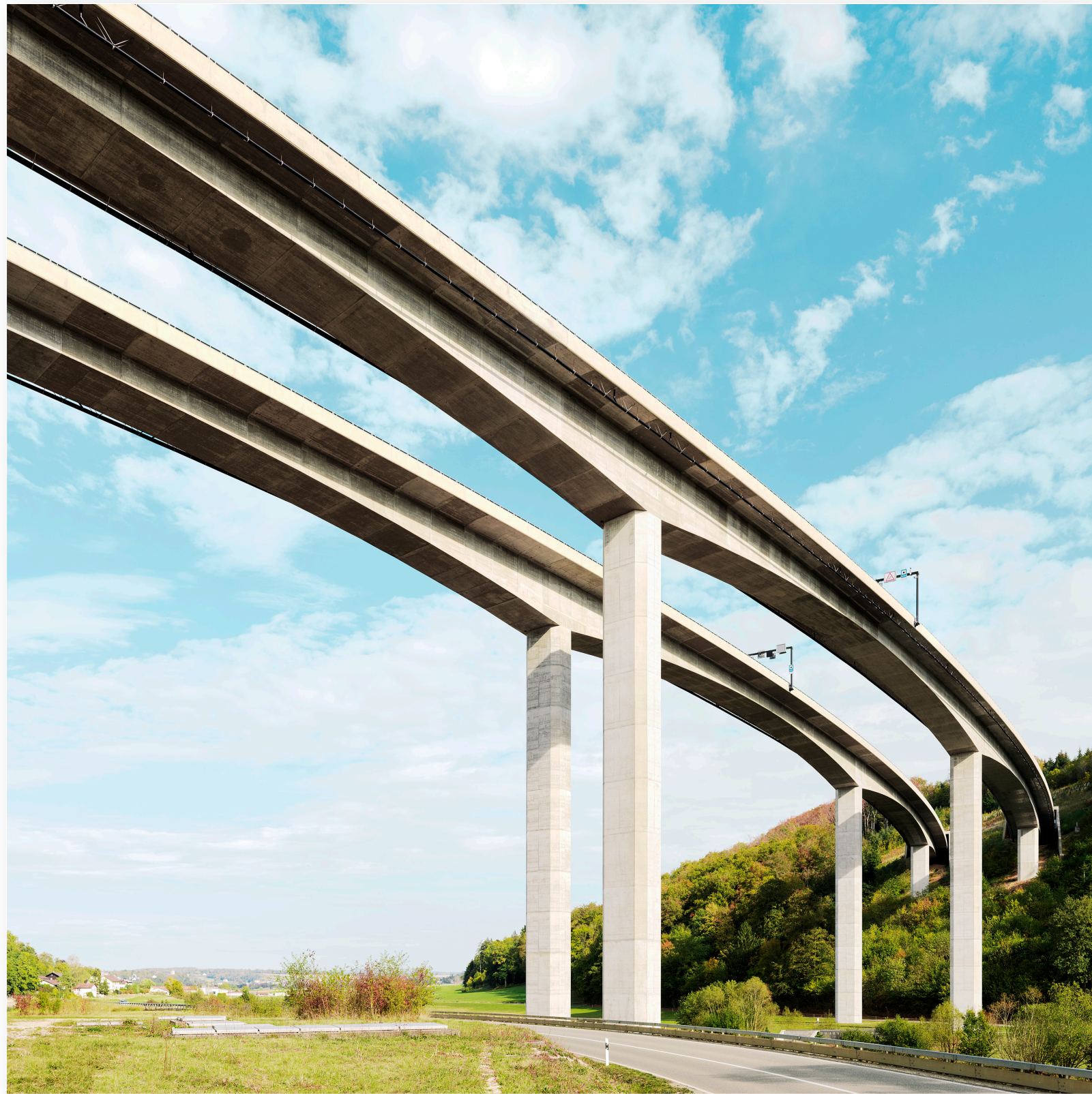
Autobahn Viadukt der A16 „Transjurane“ (JU) (2018)