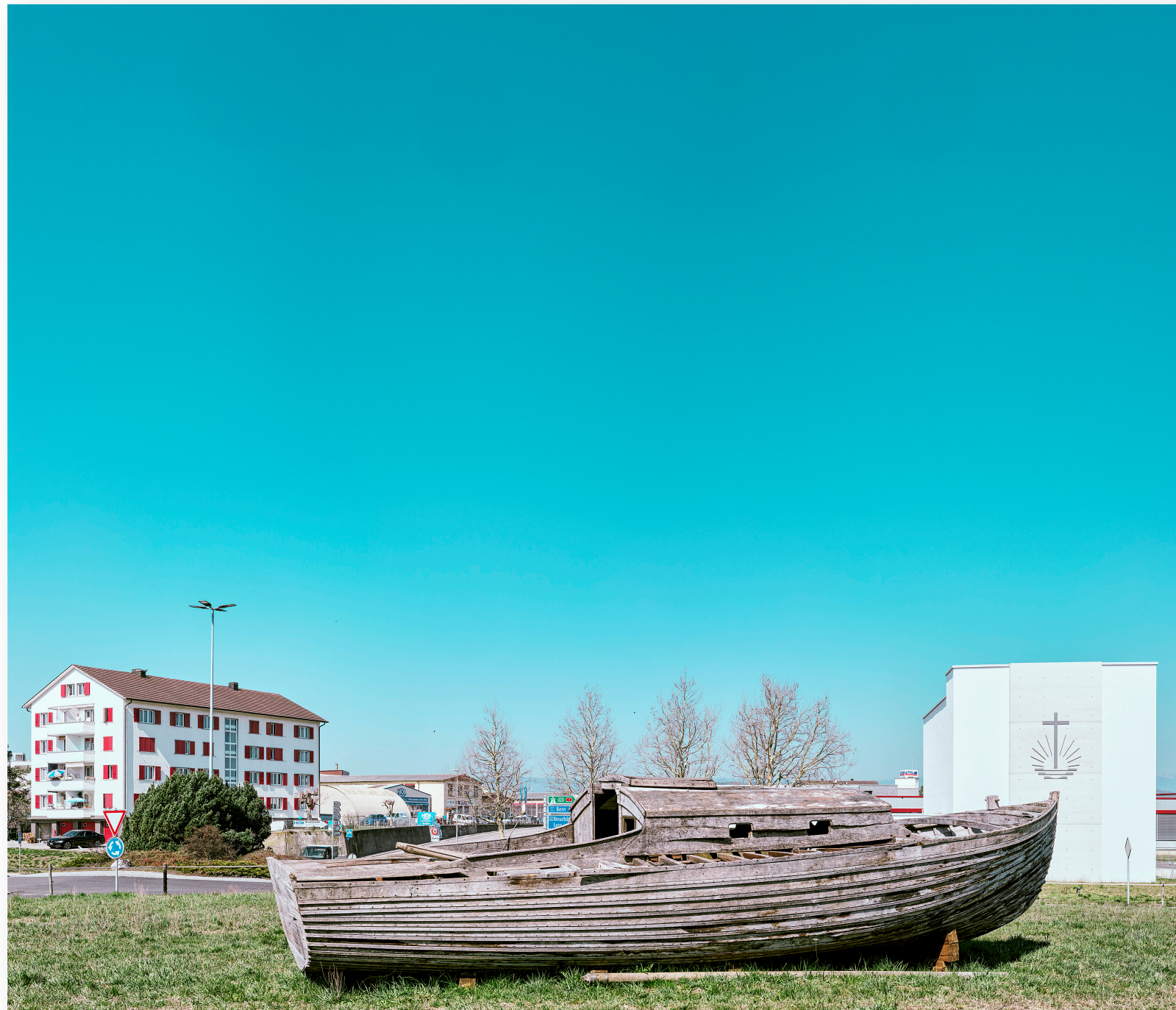
Wohnhaus mit Kirche und vielleicht das Boot Noha's, irgendwo in der Westschweiz (2019)