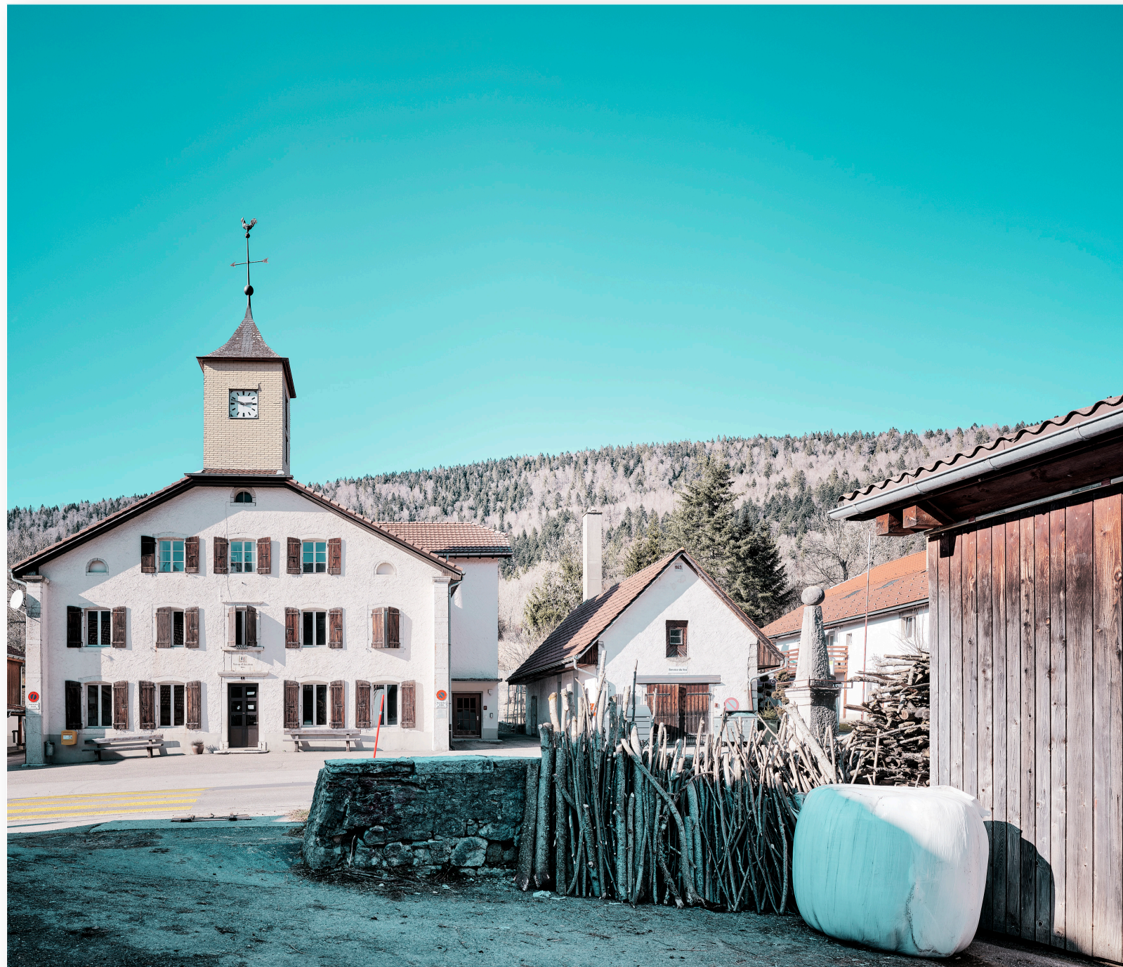
Gemeindehaus „Le Pâquier“ (NE) (2019)