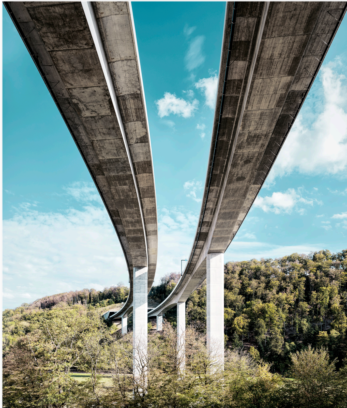
Autobahn Viadukt der A16 „Transjurane“ (JU) (2018)