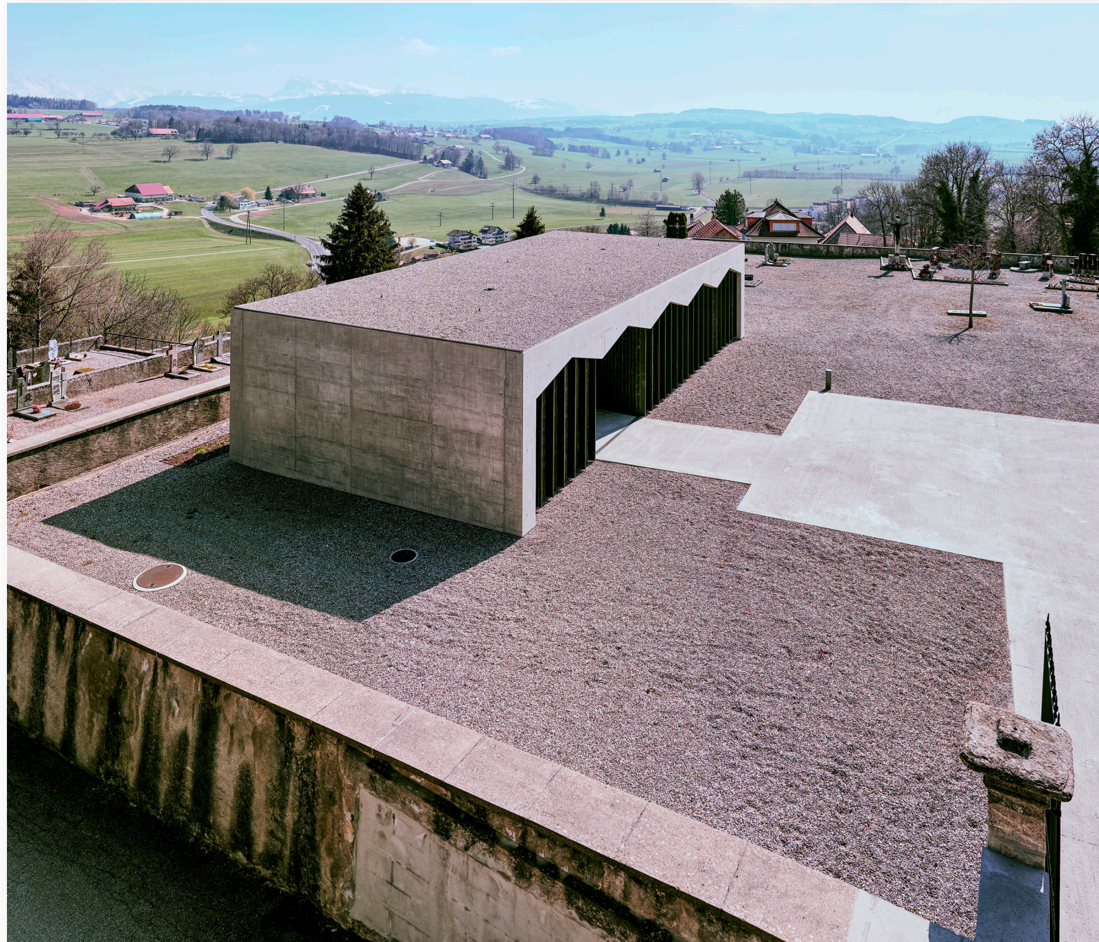
Aufbahrungshalle mit Friedhof in Romont (2019)