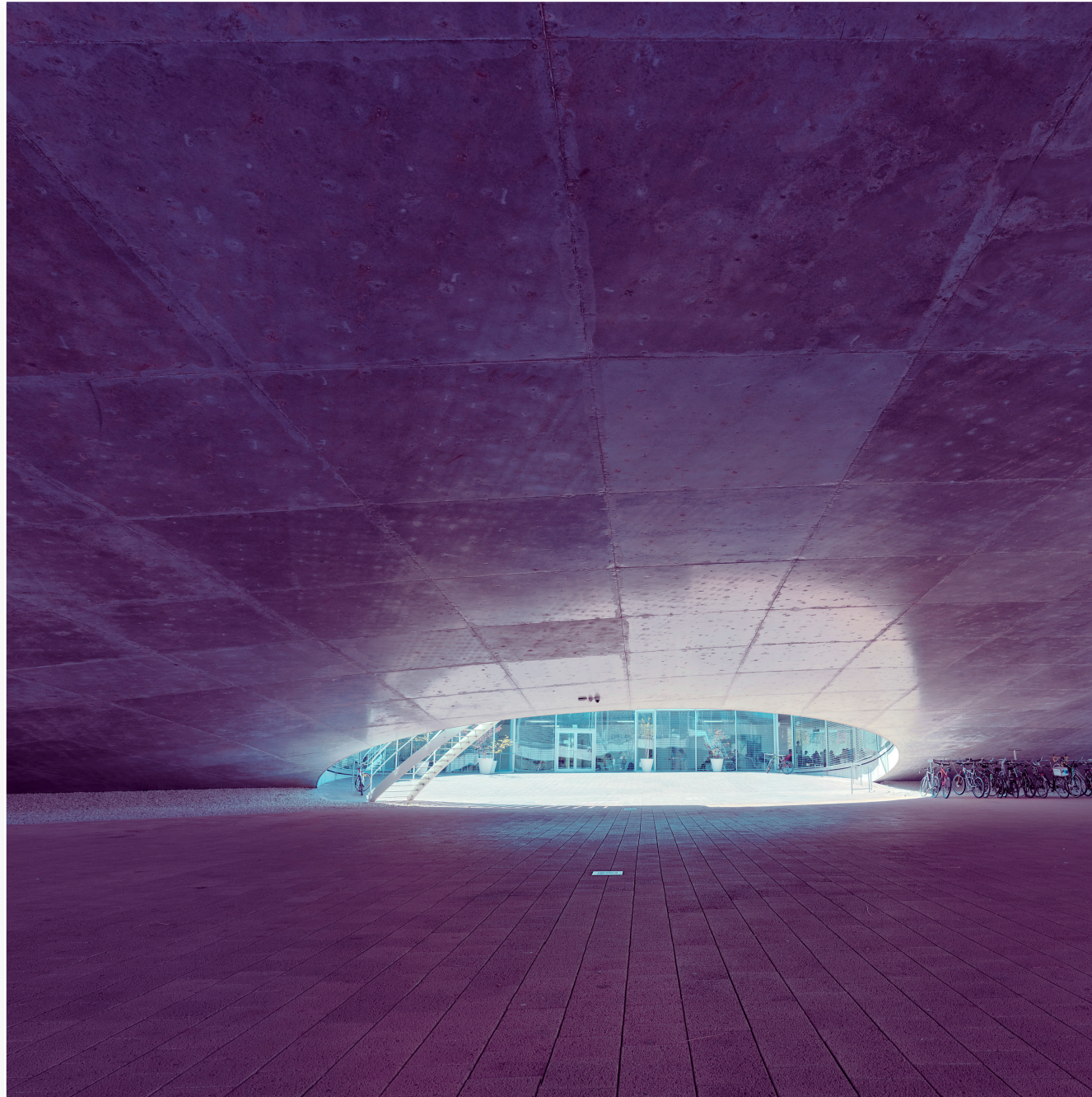
etwas ausserhalb von Lausanne, das extrem flache, aber über eine grosse Fläche liegende Hauptgebäude des EPFL Zentrum (2020)