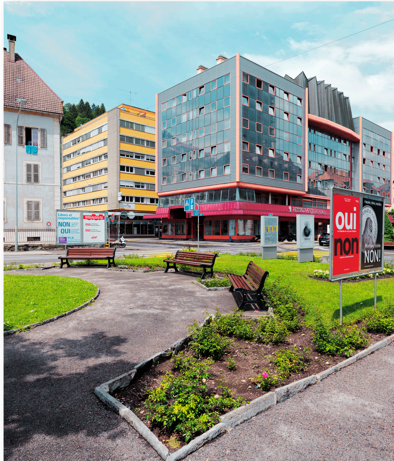
Le Locle (NE) mit Hotel „Trois Rois“ (drei Könige) (2018)