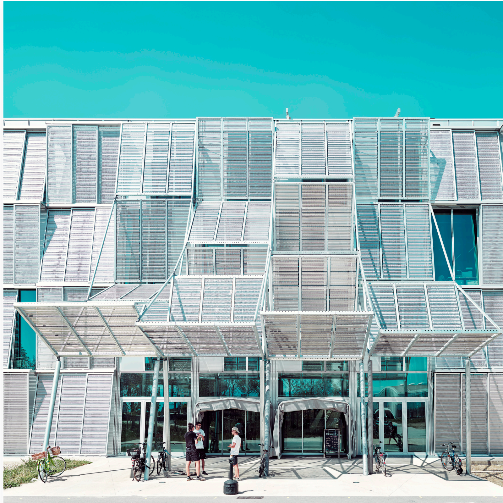
etwas ausserhalb von Lausanne, eines der Gebäude mit Haupteingang des EPFL Zentrums (2020)