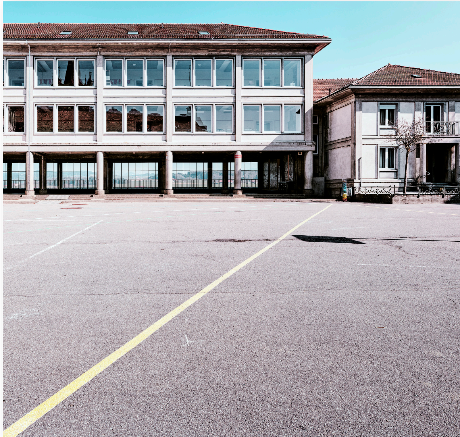
Schulhaus in Romont (2019)