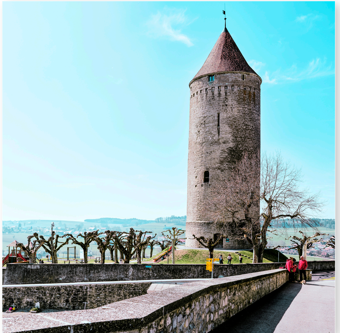
Alter Turm bei Romont (2019)

Die Westschweiz bietet immer wieder Kontraste zur üblichen Schweiz, wenn auch manchmal nur in kleinen Details. Doch genau diese machen den Unterschied.