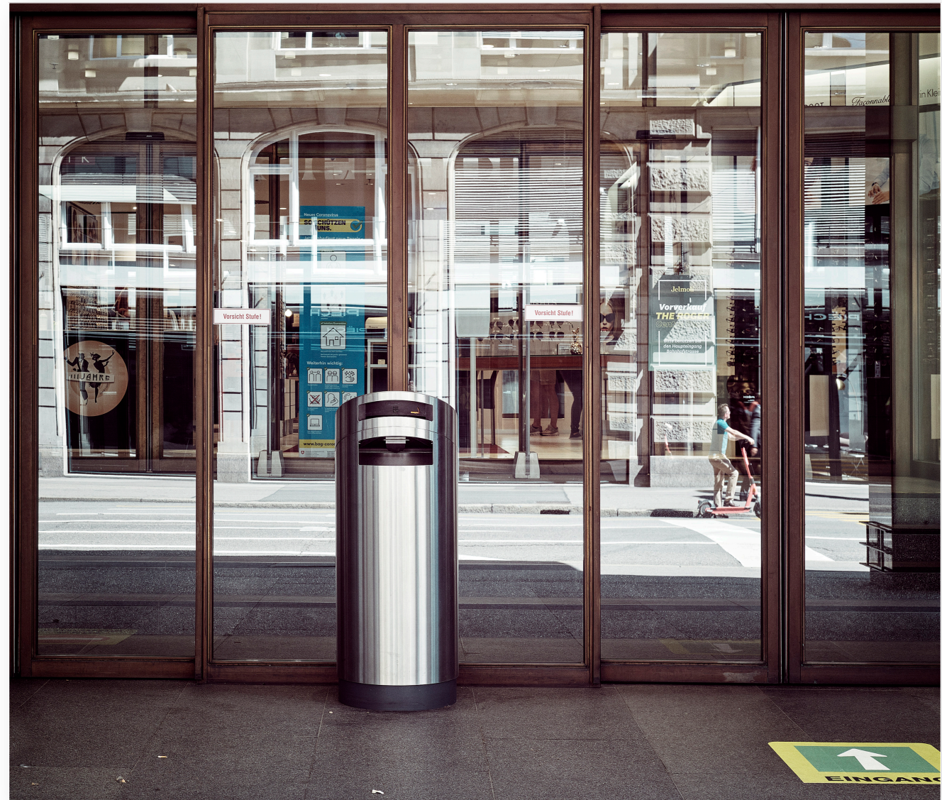
Zürich Stadtzentrum, nahe Jelmoli (2020)

Alle nachfolgenden Bilder ohne Text, sind aus dem Bezirk Letzigrund von 2020.