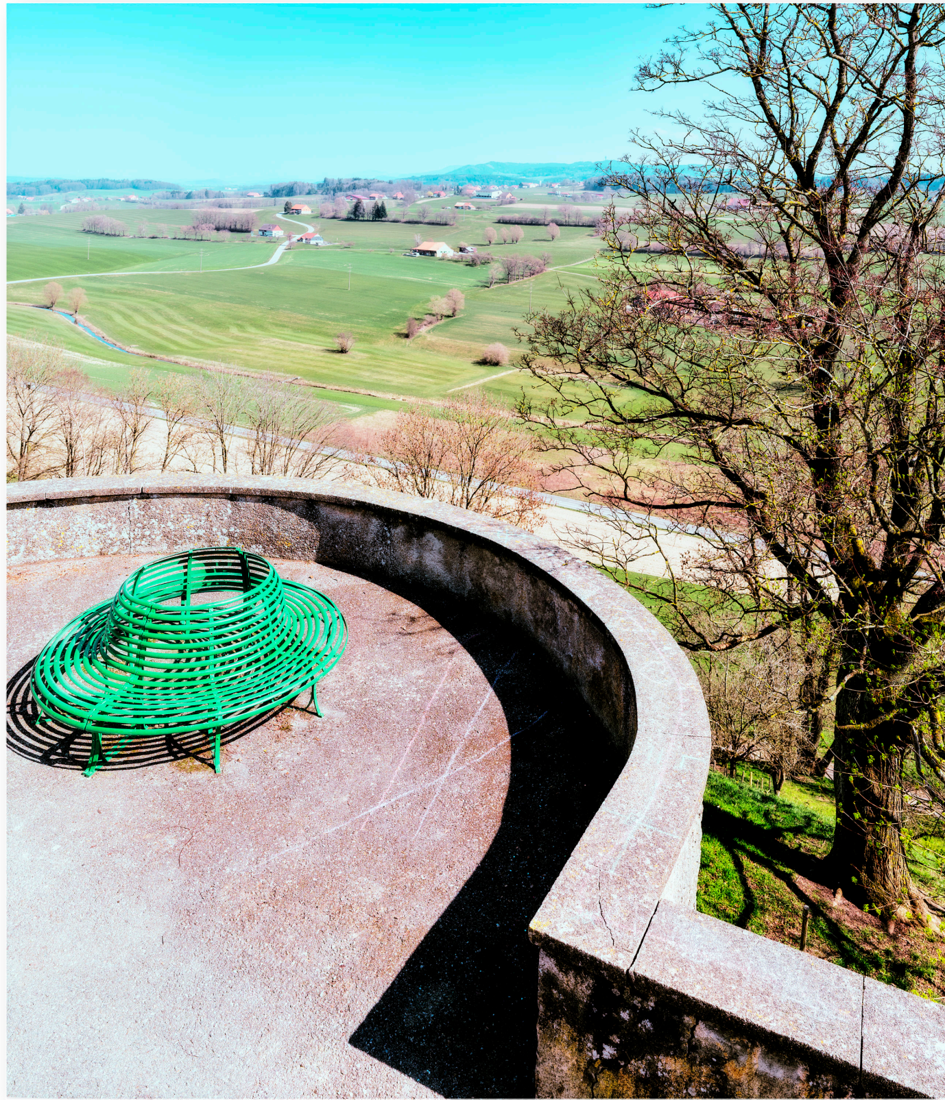
Sitzbank in Romont (2019)