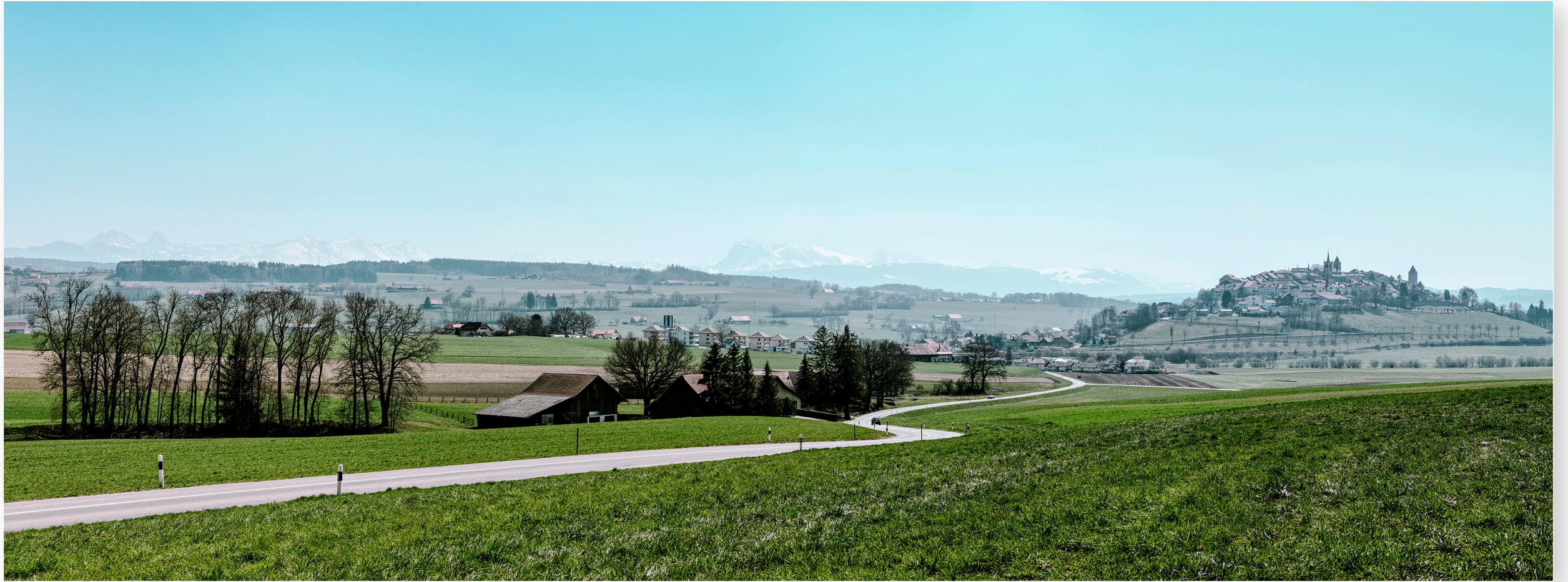
Auf dem Weg nach Romont (FR) (2019)