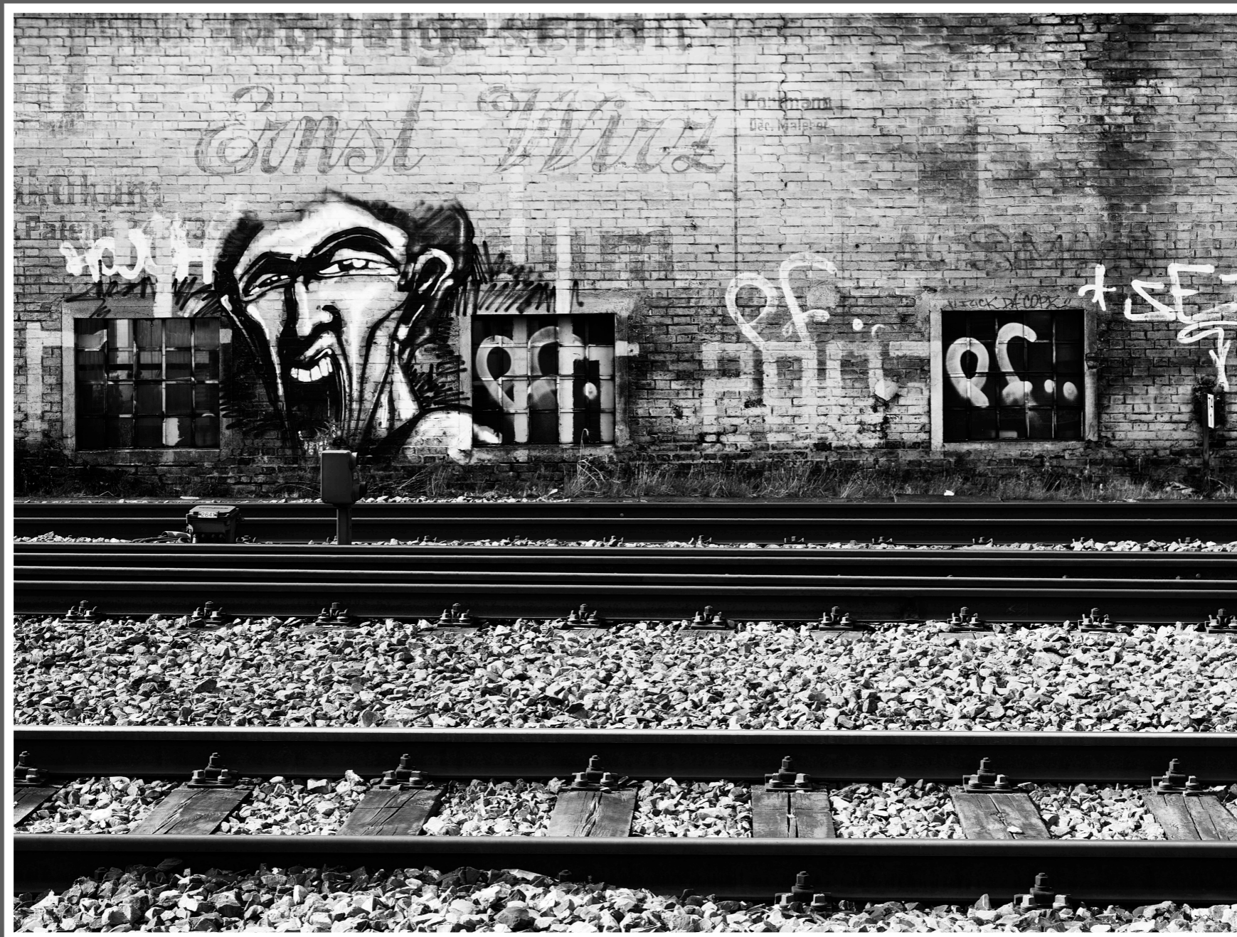
„Der Schrei“ beim Bahnhof Solothurn, Richtung Biel