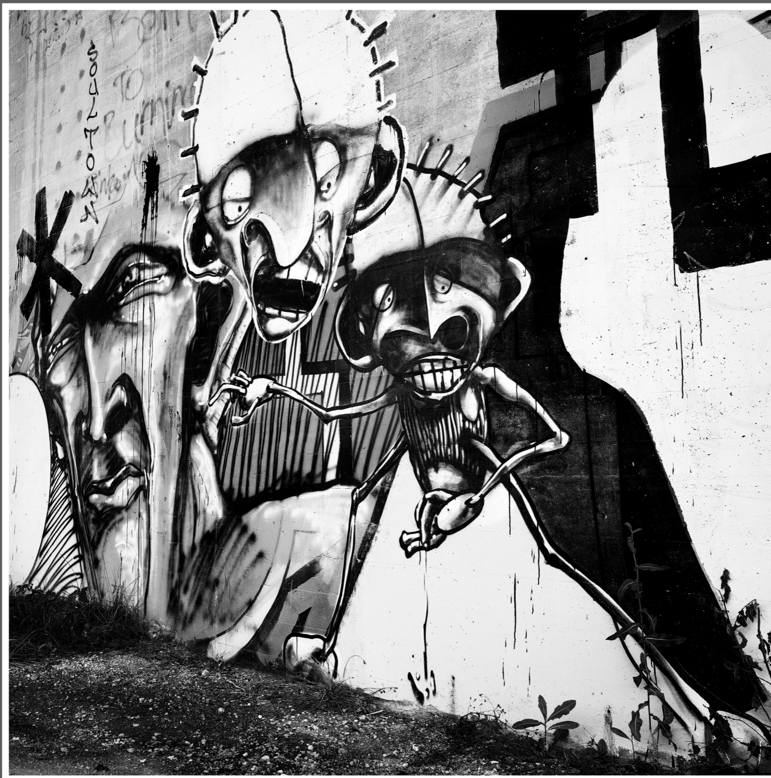
Erster Kontakt zweier Künstler, Unterführung Aareuferweg Wangen an der Aare (SO)