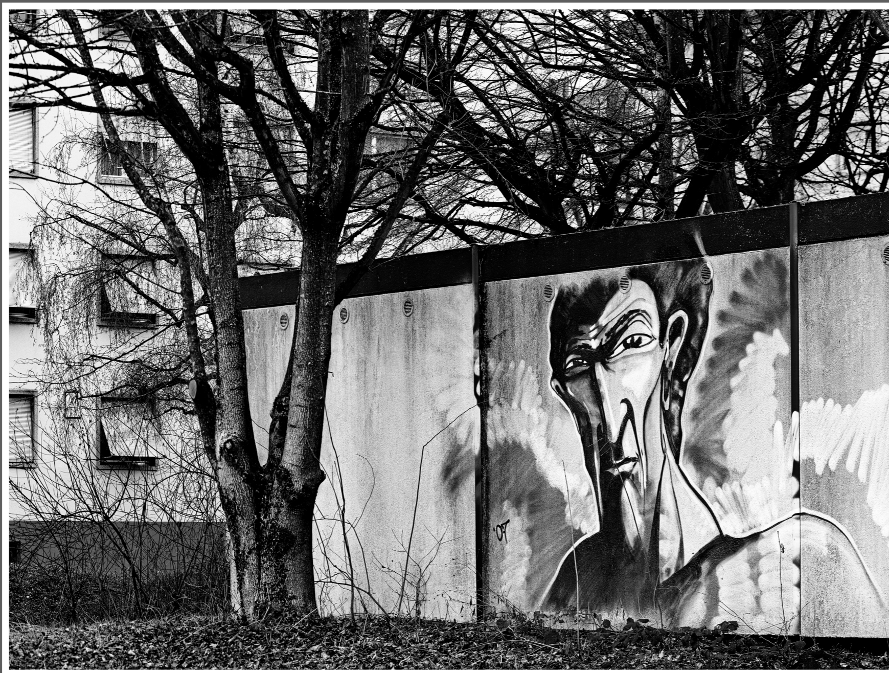
Garagerückwand von Wohnsiedlung in Zuchwil (SO)