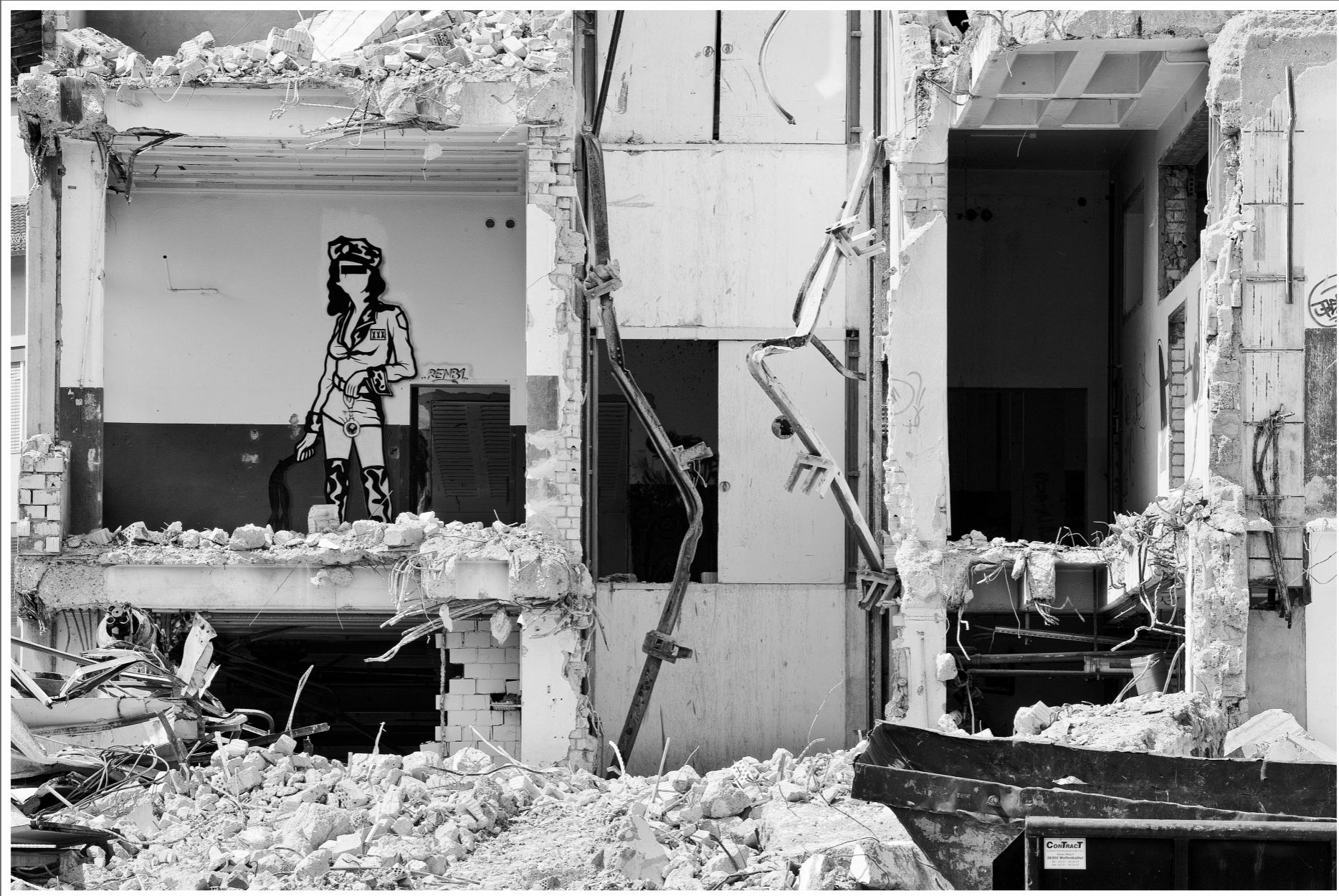
Biel (BE) Abriss von einem Haus.