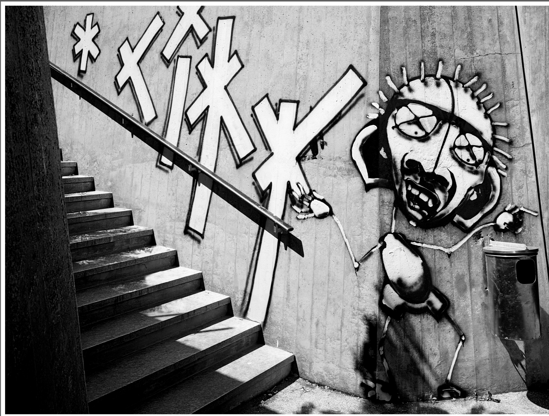
Zweiter Künstler, Unterführung Zuchwil (SO) - existiert nicht mehr!