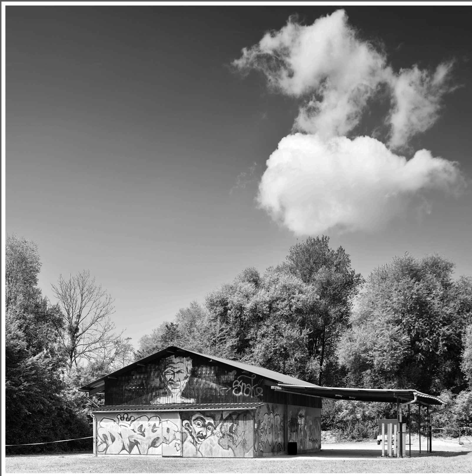
Subinger Wald- oder Schützenhaus (SO)