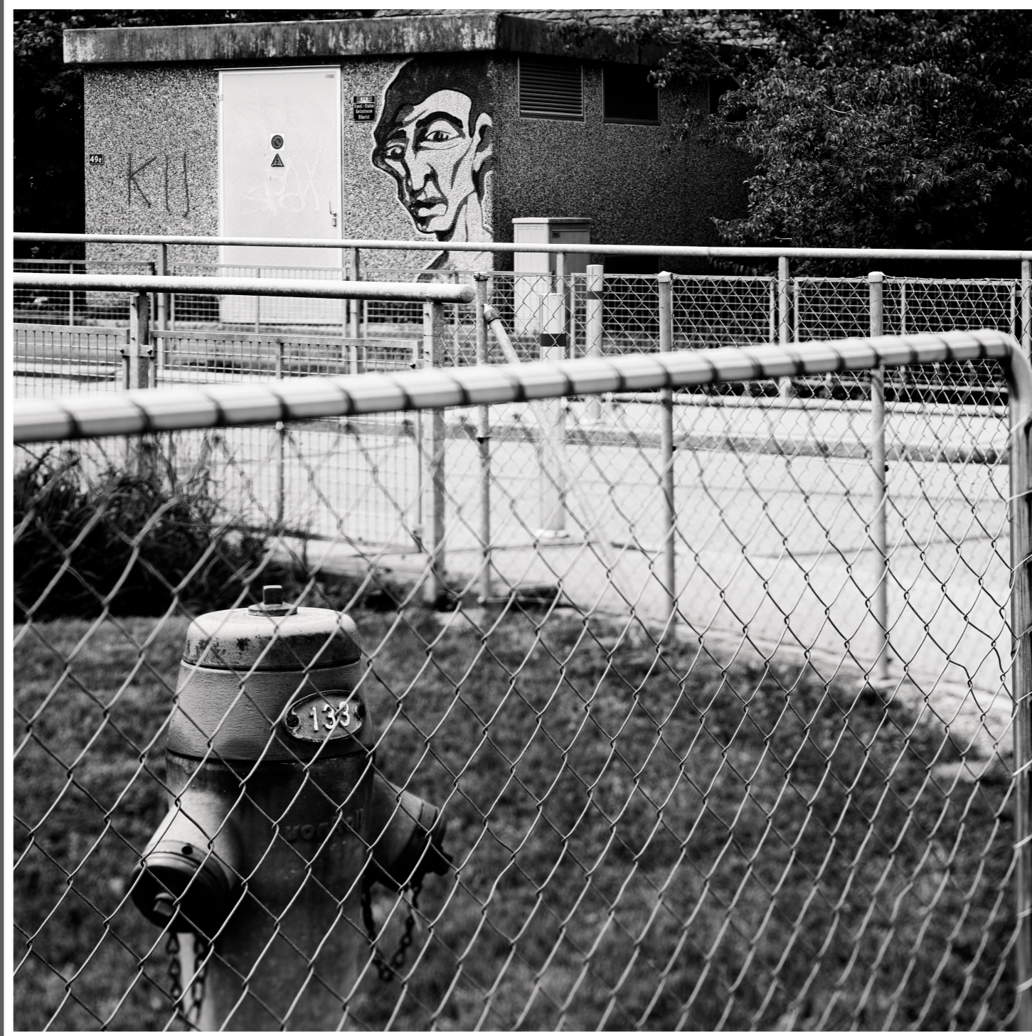
Biberist (SO) Transformerhaus