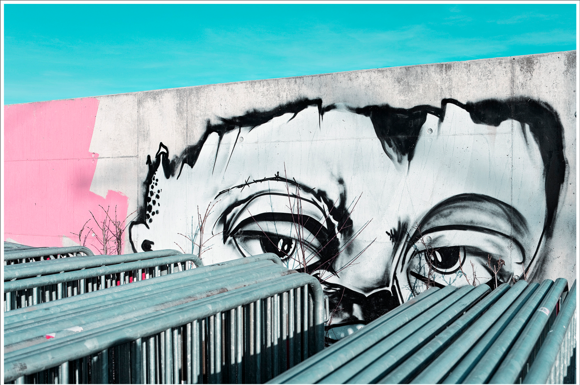
Ehemaliger Standort des sogenannten „Kofmehl-Areal“ in Solothurn, dient jetzt als Lagerstätte von Absperrungen