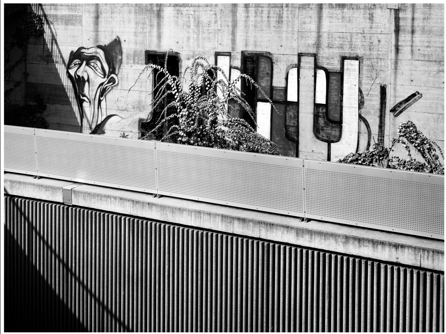
Unterführung Hauptstrasse in Derendingen (SO)