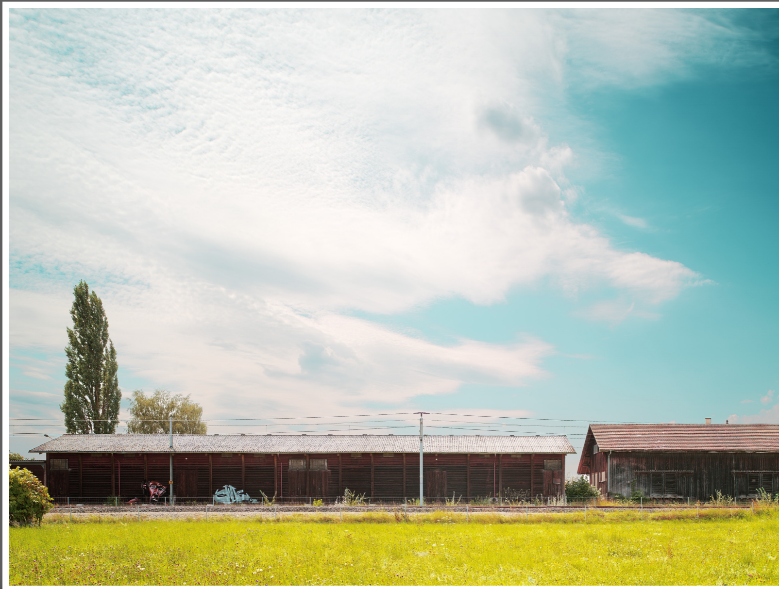
„Der Schrei“ nahe Subingen (SO)