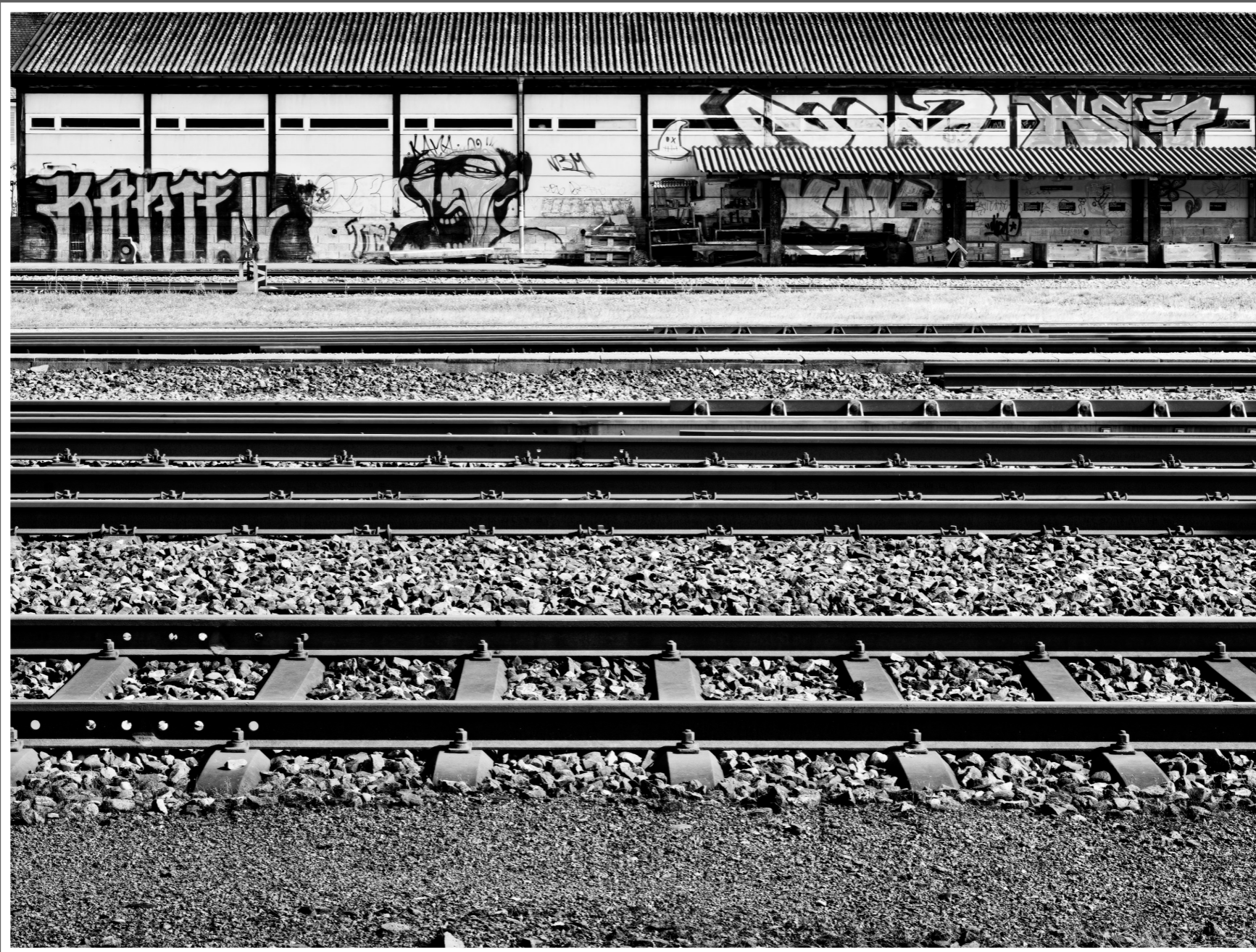
„Der Schrei“ beim Bahnhof Solothurn, Richtung Olten