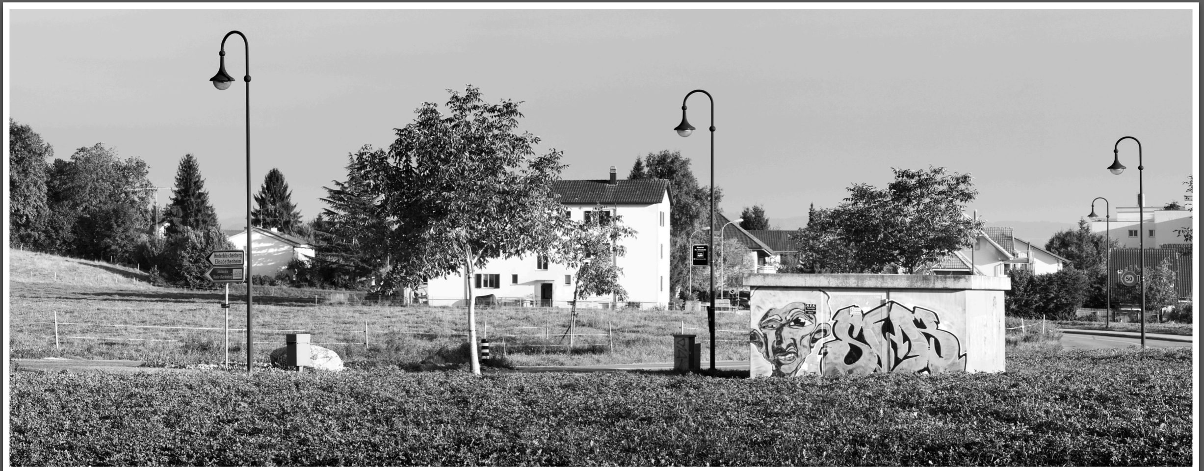
Bleichenberg-Biberist (SO) Transformerhaus