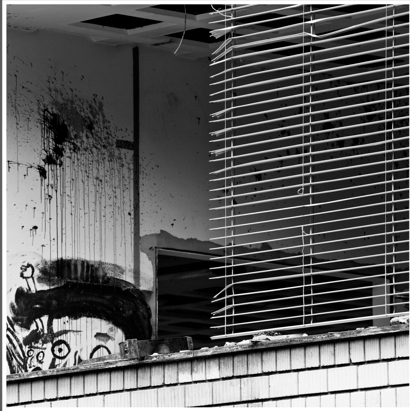
Biel (BE) Abriss von einem Haus.