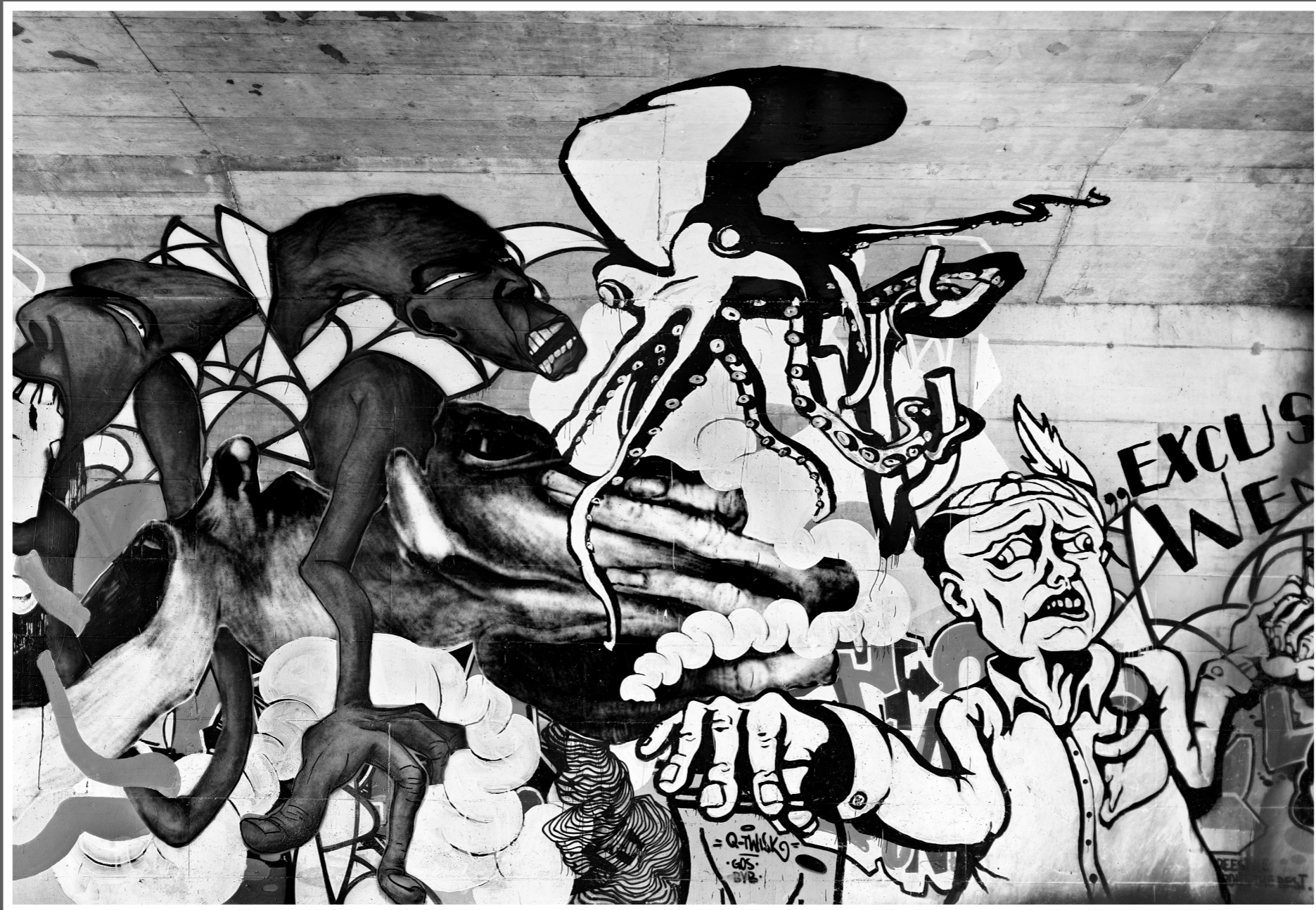
Unterführung Luterbach-SO. Ein wirklich einmaliges und besonderes Werk.