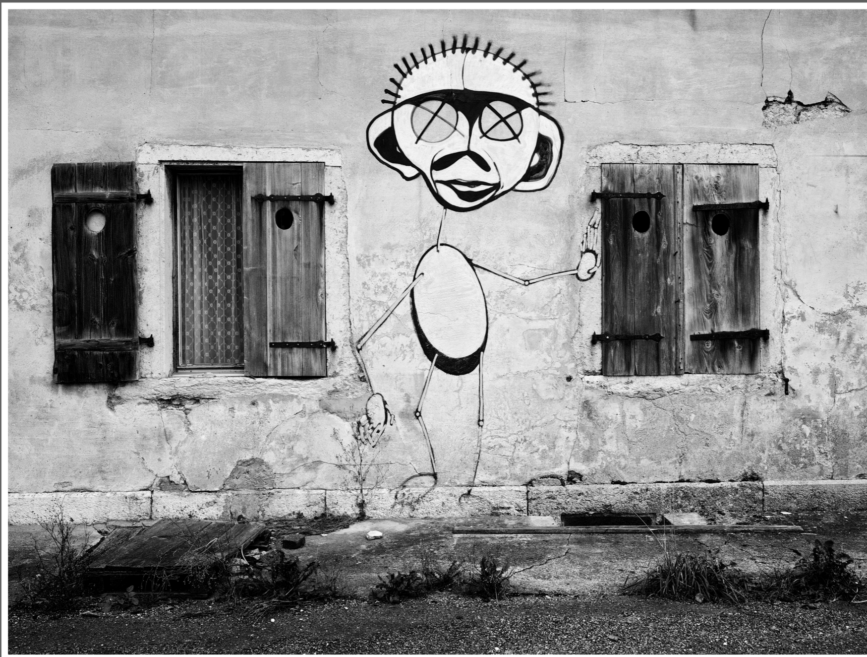
Zweiter Künstler, altes Bauernhaus - Bleichenberg-Biberist (SO)