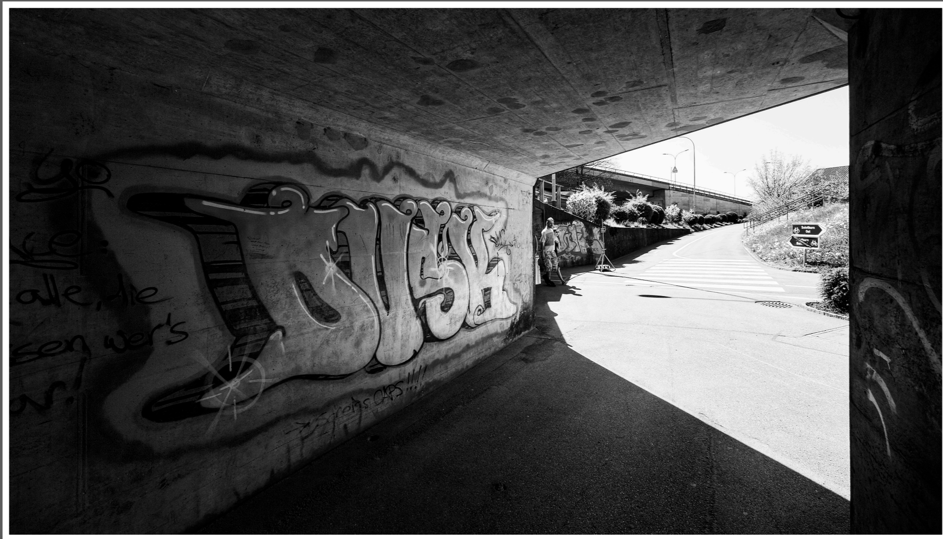
Unterführung Zuchwil-SO. „DUSK“ Dämmerung zum Hellen oder ins Dunkel.