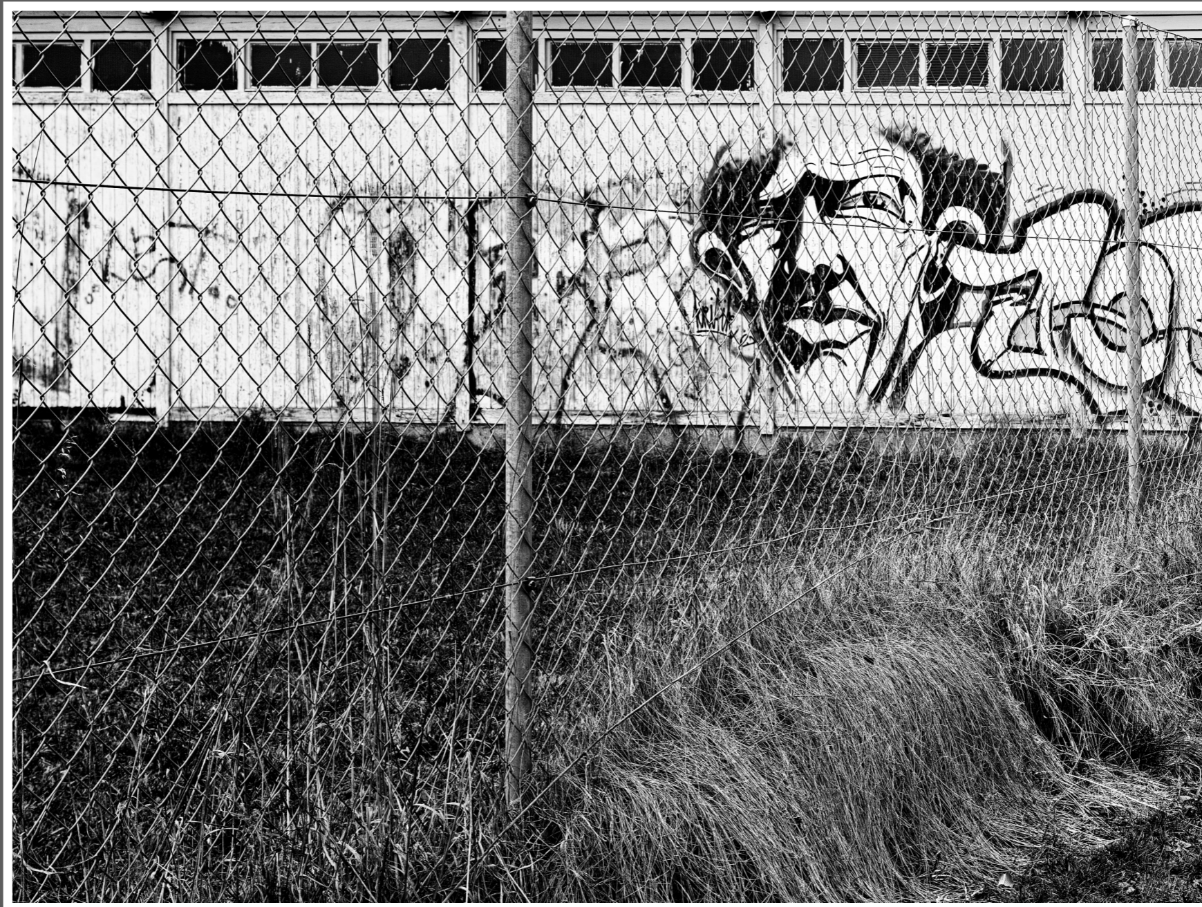
Zuchwil (SO) nahe Gartencenter Wyss