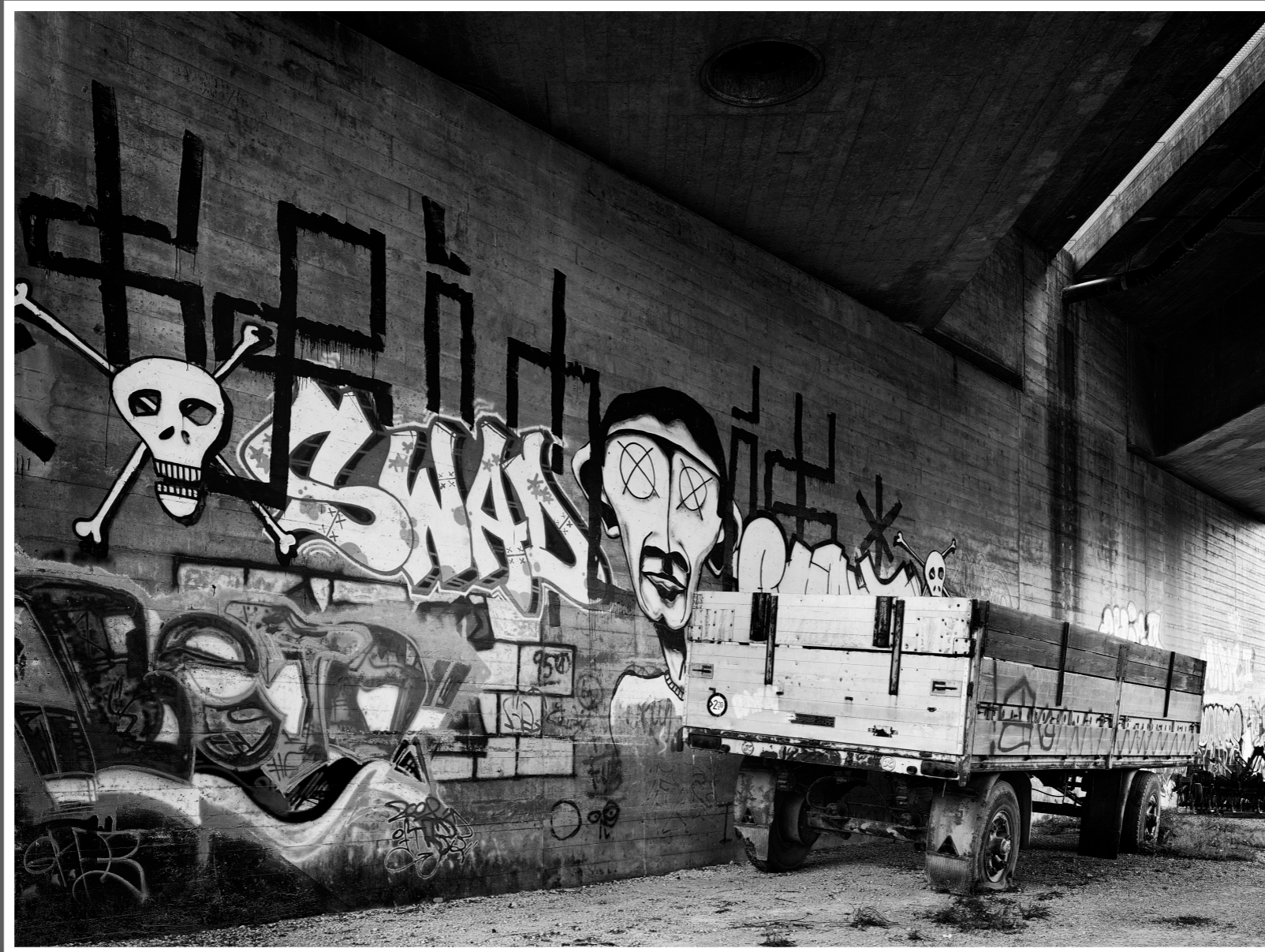
Unterführung der Autobahn über die Aare nahe Wangen an der Aare.